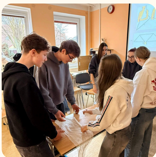
Vernisáž výstavy Cesty a návraty, 7. 5. 2026