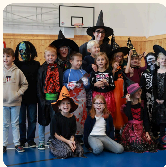
Týden pro zdraví, 8. roč., 19. 2. 2026